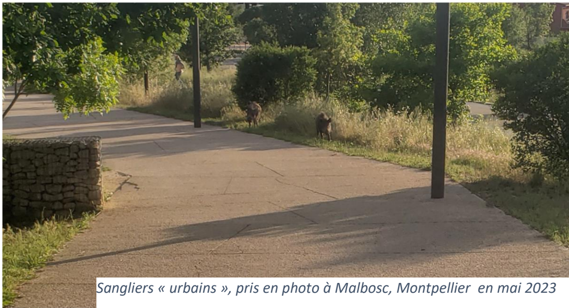
Sangliers « urbains », pris en photo à Malbosc, Montpellier en mai 2023