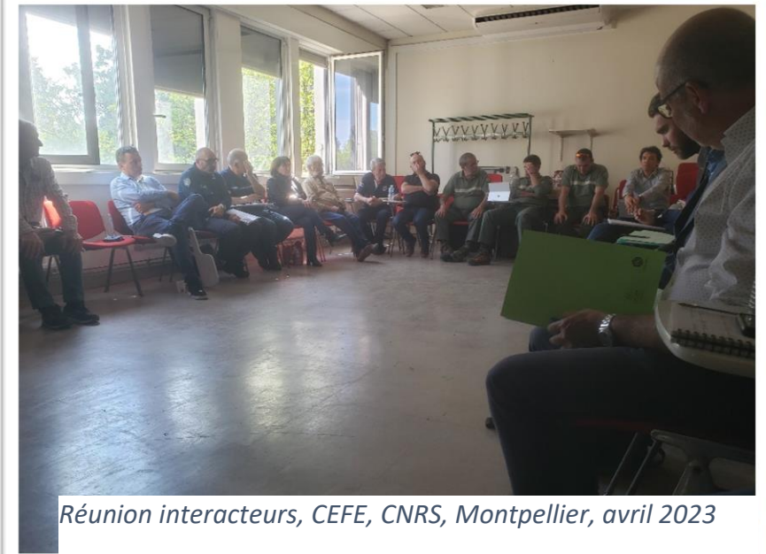
Réunion interacteurs, CEFE, CNRS, Montpellier, avril 2023