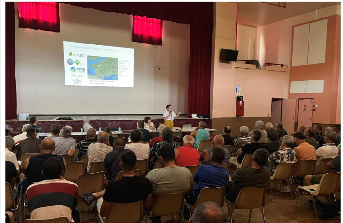
Présentation du projet BOUNDARYBOAR à l'occasion d'une réunion « Grand Gibier » organisée par la FDC34.