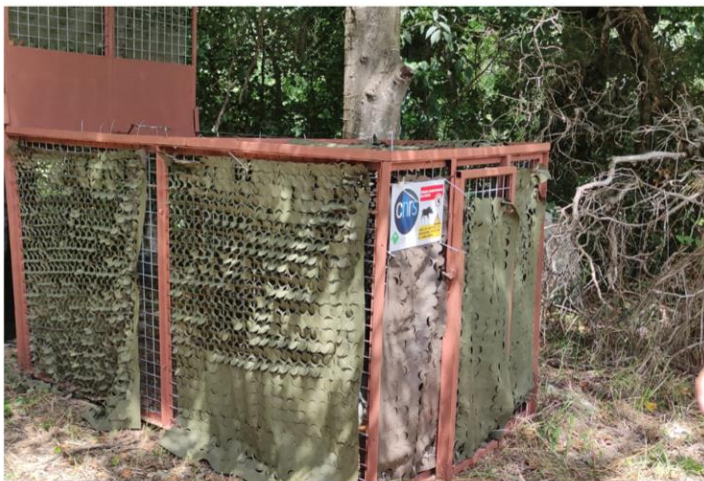
Installation d'une cage de capture de sangliers pour les équiper de colliers GPS à Montpellier